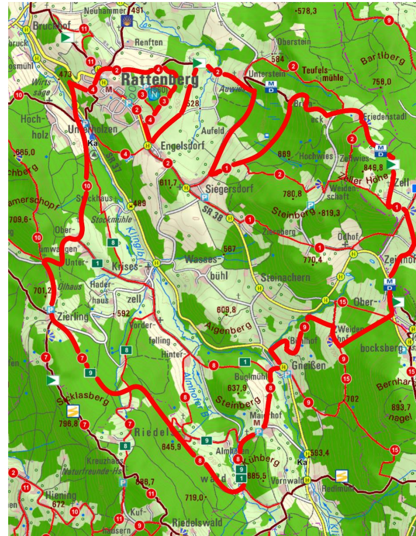
Karte: ©Bayerische Landesvermessung, DTK50; Naturpark Bayerischer Wald e.V.

Autor: ©Elke Böhm; Stand 8.2016 – Änderungen vorbehalten